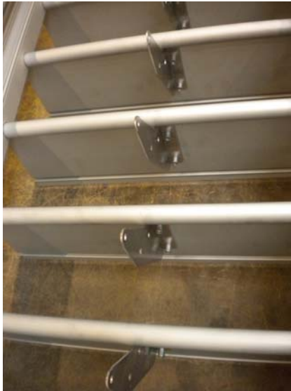
Appareil sans isolant