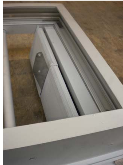
Appareil avec isolant

Etape 1 : préparer le cache bavette en appliquant un cordon de silicone à l'intérieur et sur toute la longueur