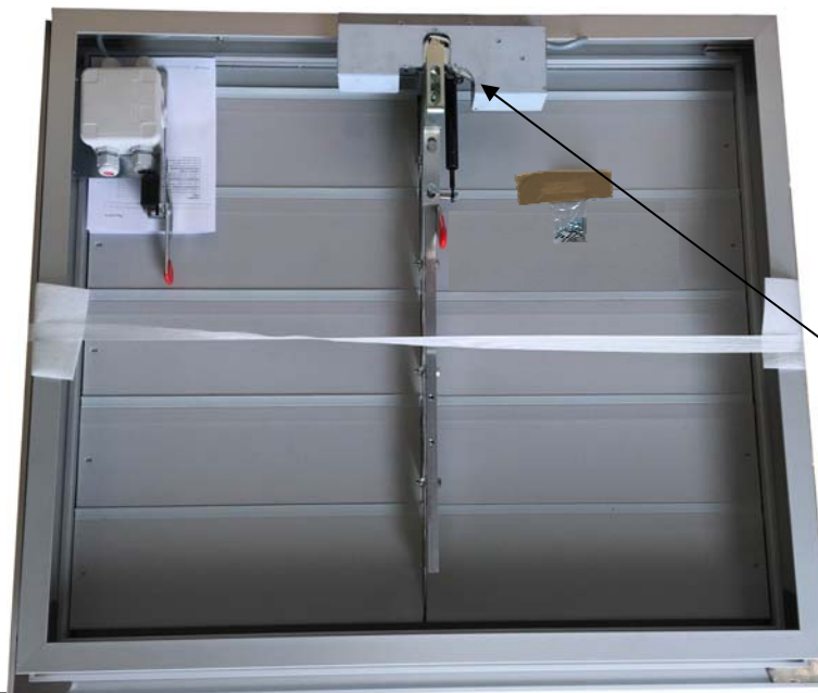
Capot de verrou