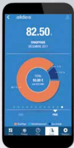
Relevés de vos consommations énergétiques en kWh et Euros.