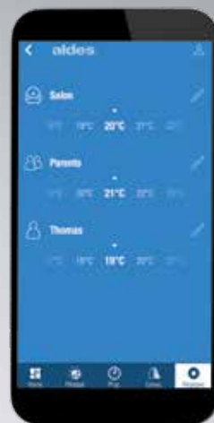
Réglage de la température de chauffage pièce par pièce.