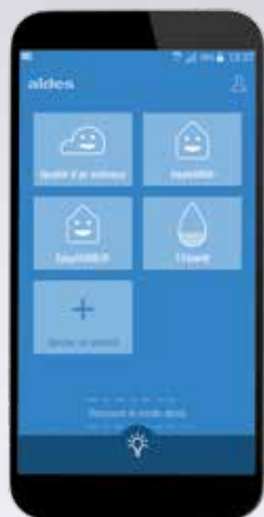
La gestion multi-produits vous permet d'avoir accès à tout votre écosystème Aldes.