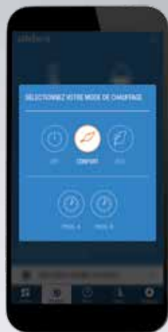
Changement du mode de fonctionnement à distance.