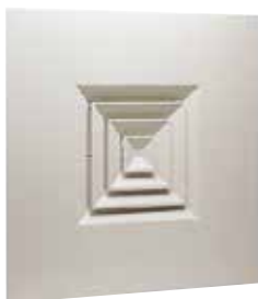
AN 704 TP

Le AN 704 TP est un diffuseur carré pour dalle de plafond avec 4 directions de soufflage pour la diffusion d'air dans les locaux tertiaires.