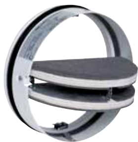
Cartouche coupe-feu CF1/ CF2

La Cartouche Coupe-feu CF1/CF2 fait partie de la gamme de clapets terminaux coupe-feu à destination des bâtiments tertiaires et industriels.