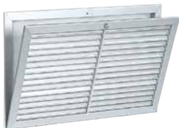
Grille AC 161

La grille murale ouvrante en aluminium avec filtre AC 161 permet la reprise d'air pour des systèmes de ventilation ou de conditionnement d'air.