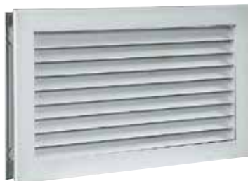
AC 181 F1 500x300

La grille de transfert AC 181 permet la circulation d'air d'un local à un autre tout en préservant l'intimité grâce à sa fonction anti-vue.