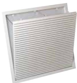
AG 637TZ W3 F0 554x254 RAL9010std

La grille en plafond ouvrante en aluminium avec filtre AG 637 permet la reprise d'air pour des systèmes de ventilation ou de conditionnement d'air.