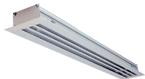
ALD613 1150 ALU + DAMPER

Le ALD 610 - 620 est un diffuseur linéaire en aluminium à fentes fixes pour la diffusion ou la reprise d'air dans les bâtiments tertiaires.