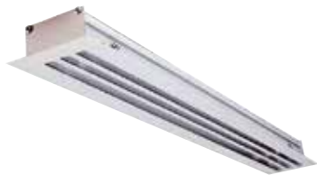
ALD613 1150 ALU + DAMPER

Le ALD 610 - 620 est un diffuseur linéaire en aluminium à fentes fixes pour la diffusion ou la reprise d'air dans les bâtiments tertiaires.