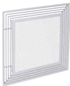
ALD613K AxB 600x600 COMBINED

L'ALD 610 K Combined est un diffuseur carré multi-fentes 4 directions pour la diffusion et la reprise d'air combinées dans les bâtiments tertiaires.