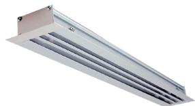
Diffuseur ALD 610 - 620

Le ALD 610 - 620 est un diffuseur linéaire en aluminium à fentes fixes pour la diffusion ou la reprise d'air dans les bâtiments tertiaires.