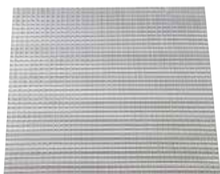
Grille AO 123

La grille de plafond en aluminium AO 123 permet la reprise d'air dans un local pour des installations de ventilation ou de conditionnement d'air.