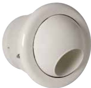
AR 190 THERMO D230 RAL9010-85%

L'AR 190 Thermo est un diffuseur à longue portée pour la diffusion d'air dans les bâtiments tertiaires avec une grande hauteur sous plafond.