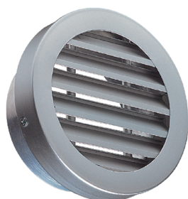
AR637 F0 D200

La grille extérieure circulaire murale AR 637 permet la prise d'air ou le rejet d'air vicié sans risque d'entrée de pluie grâce à la forme des ailettes.