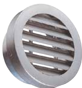
AR637 F0 D250

La grille extérieure circulaire murale AR 637 permet la prise d'air ou le rejet d'air vicié sans risque d'entrée de pluie grâce à la forme des ailettes.