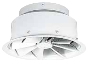
AR 883 D500 (c63)

L'AR 883 est un diffuseur à haute induction à jet d'air hélicoïdal pour la diffusion d'air dans les bâtiments tertiaires grande hauteur sous plafond.