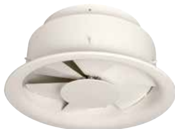
Diffuseur AR 883

L'AR 883 est un diffuseur à haute induction à jet d'air hélicoïdal pour la diffusion d'air dans les bâtiments tertiaires grande hauteur sous plafond.