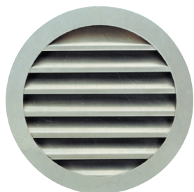
Grille AR 637

La grille extérieure circulaire murale AR 637 permet la prise d'air ou le rejet d'air vicié sans risque d'entrée de pluie grâce à la forme des ailettes.