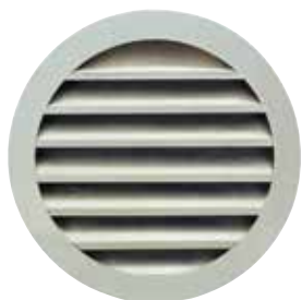
Grille AR 637

La grille extérieure circulaire murale AR 637 permet la prise d'air ou le rejet d'air vicié sans risque d'entrée de pluie grâce à la forme des ailettes.