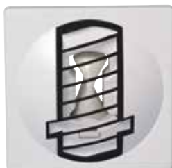
BAP COLOR GRIS

La bouche BAP COLOR Standard Fixe est idéale pour les logements en rénovation, elle permet de garantir un débit d'air constant en permanence quelles que soient les conditions dans le logement.