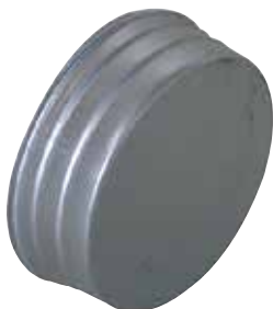
Bouchon Mâle Femelle en aluminium

Le bouchon mâle femelle alu permet de boucher un conduit ou un accessoire en aluminium dans les locaux tertiaires et les logements collectifs.