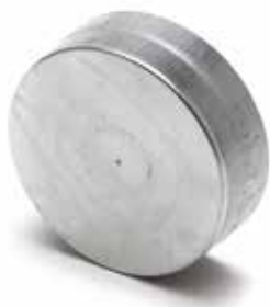
Bouchon Mâle Femelle

Le Bouchon Mâle Femelle permet de boucher un conduit ou un accessoire en acier galvanisé dans les locaux tertiaires et les logements collectifs.