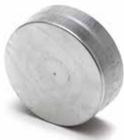
Bouchon Mâle Femelle

Le Bouchon Mâle Femelle permet de boucher un conduit ou un accessoire en acier galvanisé dans les locaux tertiaires et les logements collectifs.