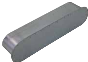
Bouchon Mâle Oblong

Le bouchon mâle oblong permet de boucher la partie terminal d'un réseau oblong dans les locaux tertiaires et logements collectifs.