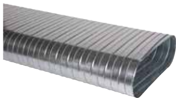
Conduits Spirales Rigides Oblongs

Le conduit galvanisé oblong est une alternative performante aux réseaux rectangulaires permettant le passage de gros débits d'air en espace réduit.