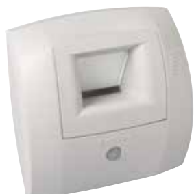
Bahia Curve sanitaire Présence

La bouche BAHIA CURVE S est une bouche hygroréglable à destination des sanitaires (Salle de bain et WC) permettant de garantir l'extraction suffisante et permanente des pollutions intérieures en fonction du taux d'humidité dans la pièce.