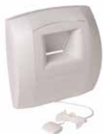
BOUCHE BW32 BAHIA sans fût cordelette

La bouche BAHIA CURVE S est une bouche hygroréglable à destination des sanitaires (Salle de bain et WC) permettant de garantir l'extraction suffisante et permanente des pollutions intérieures en fonction du taux d'humidité dans la pièce.