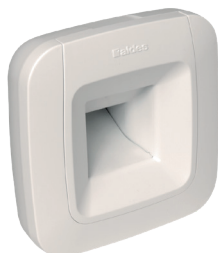
Bouche BW62 BDH

La bouche BDH ajuste le débit d'air selon l'humidité, assurant une ventilation efficace et économe pour un air sain en salle de bain et WC