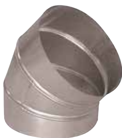
Coude 45° en aluminium

Le coude 45° alu permet de changer la direction d'un réseau aluminium de 45°.