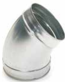
Coude 45° embouti

Le coude 45° permet de changer la direction d'un réseau galvanisé de 45°.