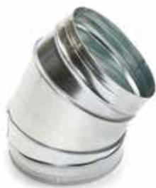
Coude 45° secteur

Le coude 45° permet de changer la direction d'un réseau galvanisé de 45°.