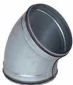
Coude 45° à joints

Le coude 45° à joints permet de changer la direction d'un réseau galvanisé de 45° tout en assurant une étanchéité classe C.