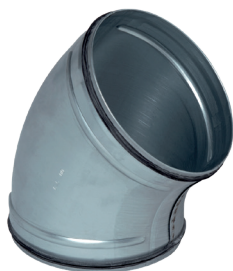
Coude 45° à joints

Le coude 45° à joints permet de changer la direction d'un réseau galvanisé de 45° tout en assurant une étanchéité classe C.