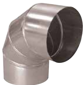
Coude 90° en aluminium

Le coude 90° alu permet de changer la direction d'un réseau aluminium de 90°.