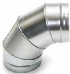
Coude 90° secteur

Le coude 90° permet de changer la direction d'un réseau galvanisé de 90°.