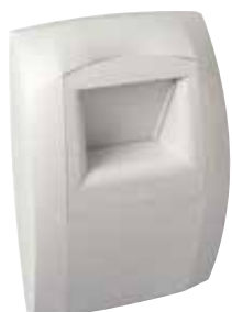
Bahia Curve cuisine

La bouche BAHIA CURVE L est une bouche hygroréglable à destination de la cuisine permettant de garantir l'extraction suffisante et permanente des pollutions intérieures en fonction du taux d'humidité dans la pièce.