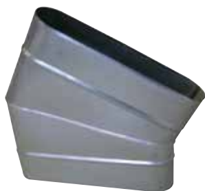
Coude Horizontal Oblong 30°

Le coude horizontal oblong 30° permet de changer la direction d'un réseau oblong de 30° dans le plan du réseau.