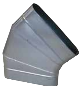
Coude Horizontal Oblong 45°

Le coude horizontal oblong 45° permet de changer la direction d'un réseau oblong de 45° dans le plan du réseau.