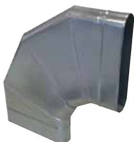
Coude Horizontal Oblong 90°

Le coude horizontal oblong 90° permet de changer la direction d'un réseau oblong de 90° dans le plan du réseau.