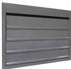
OXYTONE LAMES 2013 fermé en position attente

L'amenée d'air OXYTONE Lames 2013 assure l'apport d'air neuf en cas d'incendie et son réarmement motorisable en facilite la maintenance.