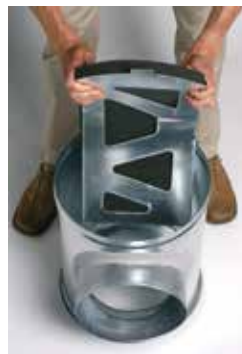
Installation du déflecteur acoustique et aéraulique dans le caisson piquage