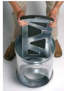
Installation du déflecteur acoustique et aéralique dans le caisson piquage