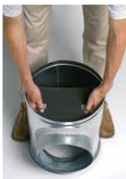
Installation du déflecteur acoustique et aéralique dans le caisson piquage