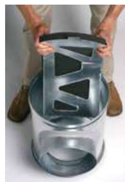
Installation du déflecteur acoustique et aéralique dans le caisson piquage