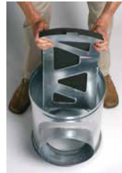
Installation du déflecteur acoustique et aéraulique dans le caisson piquage