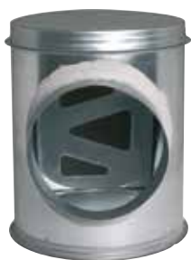
Caisson Piquage Acoustique et Aéraulique

Le CP2A assure la jonction et l'accessibilité du réseau collecteur vertical et du réseau horizontal en améliorant l'acoustique et l'aéraulique.