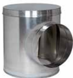
Caisson Piquage en aluminium

Le caisson piquage alu permet de joindre et de rendre accessible le réseau collecteur vertical et le réseau horizontal.