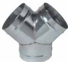
Culotte Simple 90°

La culotte simple 90° permet d'assurer la confluence de 2 branches de réseau galvanisé à 90° l'une de l'autre.