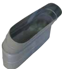
Coude Vertical Oblong 30°

Le coude vertical oblong 30° permet de changer la direction d'un réseau oblong de 30°.