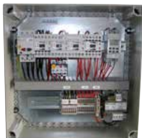
Coffret de désenfumage habitat collectif

Les coffrets de désenfumage parking habitat permettent de piloter les ventilateurs hélicoïdes 2 vitesses pour la ventilation et le désenfumage.