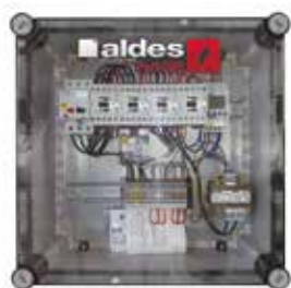
Coffret de désenfumage ParkONE habitat collectif

Les coffrets de désenfumage parking habitat permettent de piloter les ventilateurs hélicoïdes 2 vitesses pour la ventilation et le désenfumage.