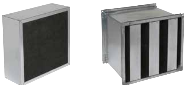
ECTA 100 L/H 2000-2400

Le piège à son rectangulaire ECTA 200 atténue fortement la propagation acoustique (basse, moyenne et haute fréquences) dans un réseau rectangulaire.